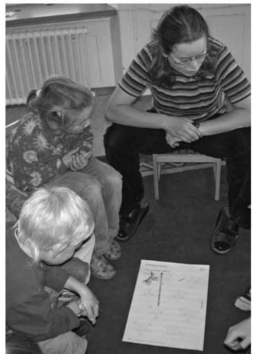
Die Lernenden haben das Bedürfnis, geführt zu werden

Der biologisch verankerte Hunger nach Stimulation bildet die Basis; auf ihm gründet der Hunger nach Zuwendung, der in seiner ursprünglichen Form ein Hunger nach Streicheln, d.h. nach sinnlicher Stimulation ist und der sich erst im Laufe der