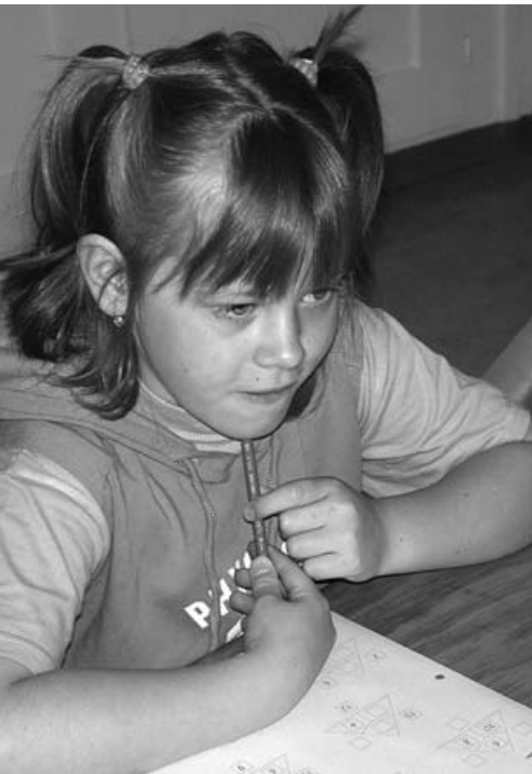
Die Lernende will den eigenen Lernweg erforschen

Schutz? Und wie bei meiner Freundin? Wie gehen wir bei uns im Kollegium mit Fehlern um, wie in der Klasse?