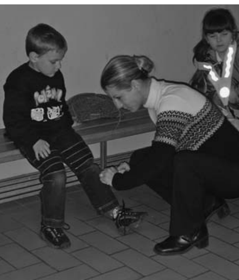
Der Lernende will die Erfahrung machen, dass es in Ordnung ist, etwas nicht zu können

Obwohl Sappho die Trennung schwer fiel, ermöglichte sie ihrer Schülerin die Trennung und versuchte nicht, sie zu manipulieren und an sich zu binden. Sie hat menschliche Grösse gezeigt, in dem sie die Schülerin dabei unterstützt, den eigenen Weg «weg von ihr» zu gehen.