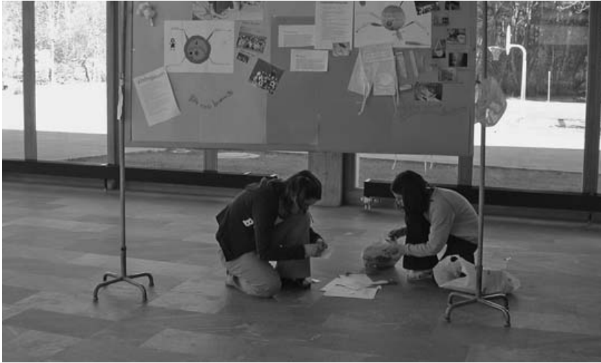
Die Lernenden brauchen Räume für die Selbststeuerung

Sozialisation zum Hunger nach Beachtung, Zuwendung und Anerkennung ausweitet. Der Hunger nach (Zeit-)Struktur gründet in den biologischen Rhythmen unseres Organismus (Wach-Schlaf-Zyklus, Schlafphasen, Tagesrhythmus, Menstruation). Auf ihnen baut sich das psychologische Bedürfnis, die Zeit zu strukturieren, um in ihr den Hunger nach Stimulierung und nach Zuwendung zu befriedigen, ebenso auf wie das Bedürfnis, sich durch genügend Informationen vor Gefahren zu schützen. Alle drei Bedürfnisse müssen lebenslang befriedigt werden.