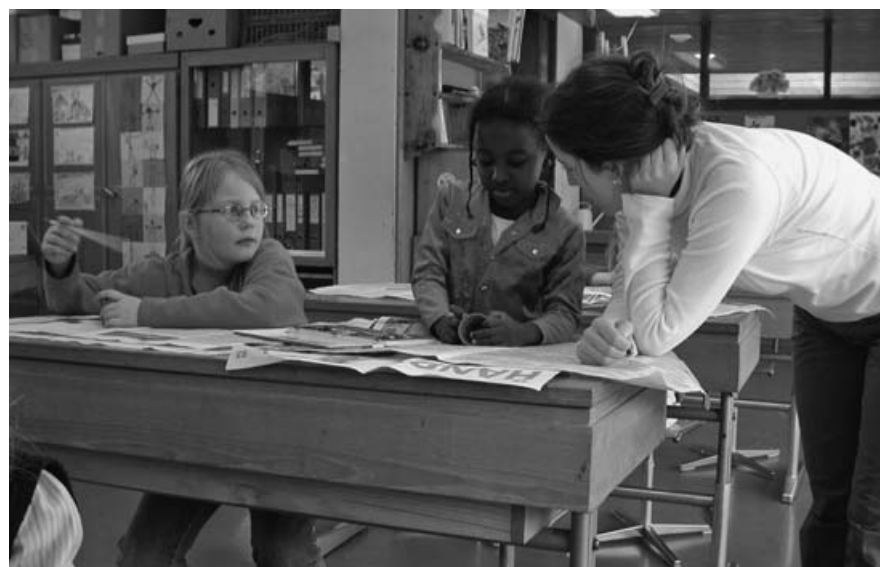
Die Lernenden wollen wahrgenommen werden.

«Neugierde, Triebbefriedigung, Lust, Erobern, Kribbeln, antike wohlgeformte Männerstatuen, versteckte nackte Tatsachen» – all das brachten Teilnehmerinnen und Teilnehmer bei verschiedenen Veranstaltungen zum Thema Sappho und Lernen miteinander in Verbindung. 16 Deutlich war der Wunsch der Teilnehmenden, Lernen als aufregend sinnliche Erfahrung zu erleben. Dazu gehörte für sie die Voraussetzung, sich mit den Lerninhalten in einer Gruppe