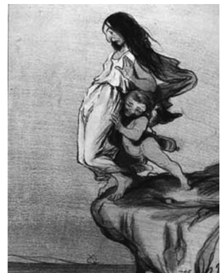
Tod der Sappho – Sprung vom Leukadischen Felsen – von Daumier

Zum Werk der Sappho gehören Götterhymnen, Hochzeits- und Liebeslieder. Ihre Dichtungen bestanden ursprünglich aus neun Bänden; sie sind jedoch alle verloren gegangen. Die Überlieferung stützt sich daher auf Verweise und Zitate der nach ihr ge-